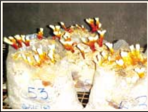
रिशी में पिन्निंग प्रारंभ

जब बैग पूरी तरह सफेद हो जाये, थोड़ा पीला पड़ने लगे और टाप पर काले बुरादे का