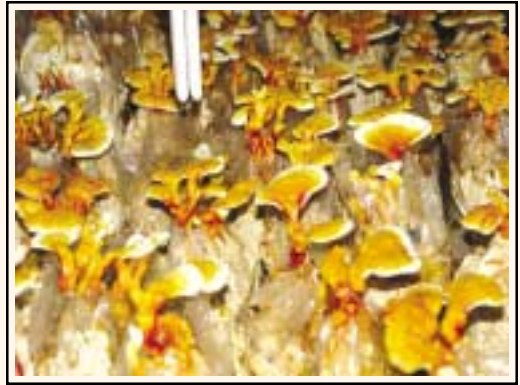
रिशी उत्पादन में प्रकाश आवश्यक

बुरादे के काले कण दिखाई देते हैं तो उस पर ग्रीन-फफूंद की बीमारी आ जाती है। अब इन कटे थैलों को उत्पादन कक्ष में रैक्स पर अच्छी तरह रख देते हैं। इन्हें खड़ा (वर्टिकल) और पट