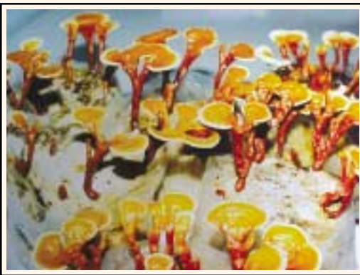
रिशी की कैप बन रही है

नामो-निशान न रह जाये तब कैंची से टॉप भाग को काट देते हैं। यदि ऊपर मुंह की ओर कुछ