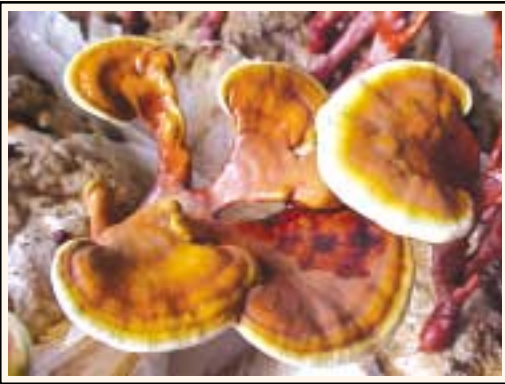
परिपक्व रिशी के स्पोर्स

पहले फ्लश लेने के बाद पुनः शुरू की स्थितियां दोहराते हैं: यानि तापमान 30°C और आर्द्रता 90 प्रतिशत से ऊपर, ताजी हवा एवं प्रकाश ताकि रिशी का दूसरा दौर (फ्लश) शुरू हो। पिनिंग के बाद उपरोक्त क्रियाओं का चक्र हू-ब-हू पूरा करना होता है। इस तरह रिशी की तीन फ्लश ली जा सकती है। तीनों फ्लशों को मिलाकर रिशी 15 से 25 प्रतिशत BE देता है: यानि एक किलो सूखे माध्यम से 150 से 250 ग्राम रिशी निकलता है।