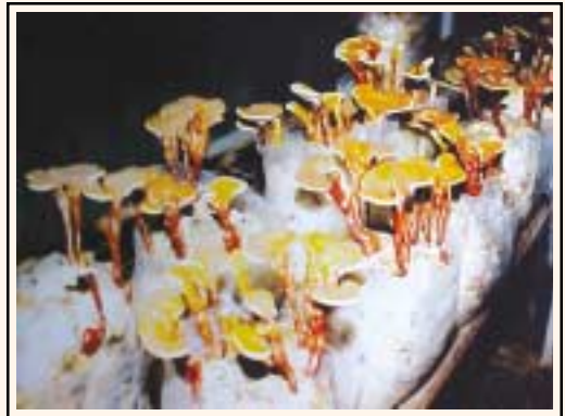
परिपक्व (मेच्योर) रिशी

बुरादे के काले कण दिखाई देते हैं तो उस पर ग्रीन-फफूंद की बीमारी आ जाती है। अब इन कटे थैलों को उत्पादन कक्ष में रैक्स पर अच्छी तरह रख देते हैं। इन्हें खड़ा (वर्टिकल) और पट